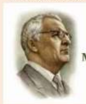
Георгий Васильевич Свиридов «Метель»

🔗 А вы знаете, как изображает осеннюю природу композитор?